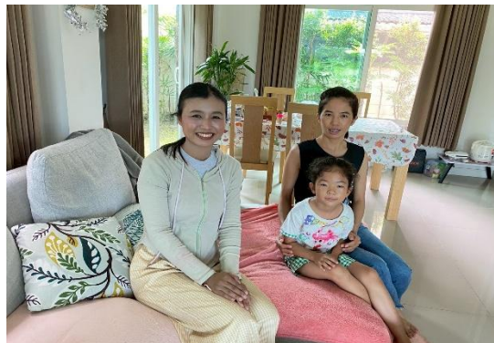
เลขที่ 26 เด็กหญิงกรองแก้ว