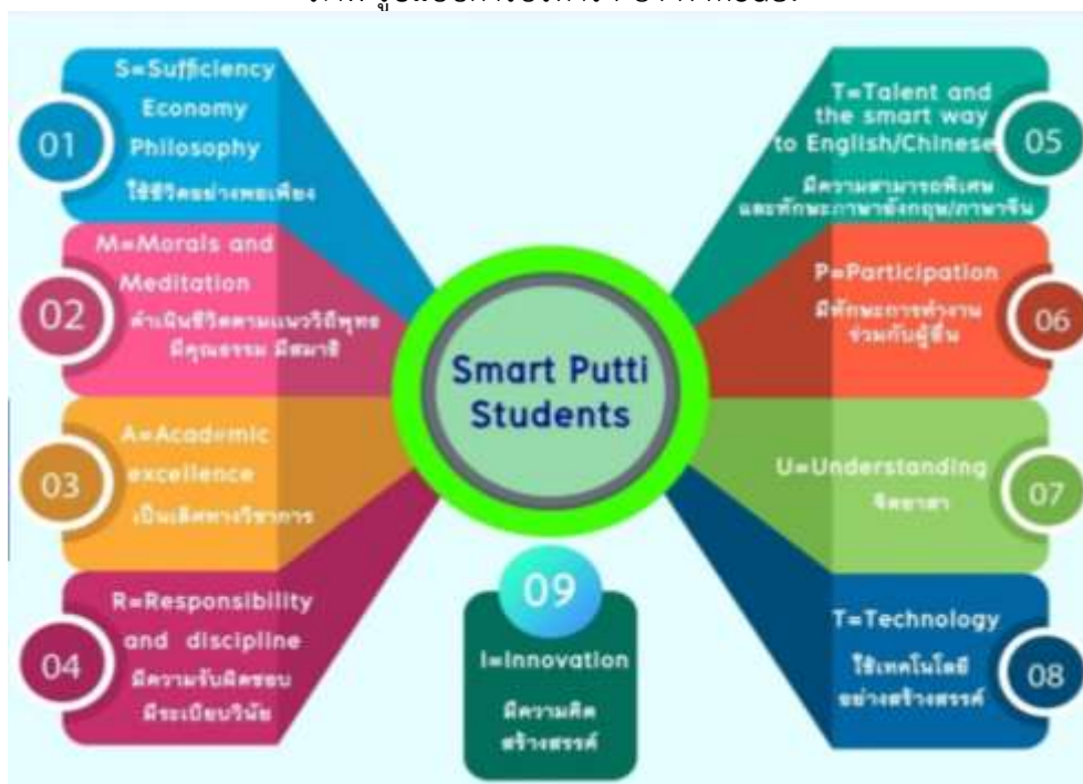
ภาพ SMART PUTTI Student