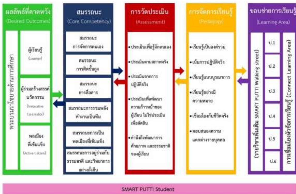
ภาพ School Concept