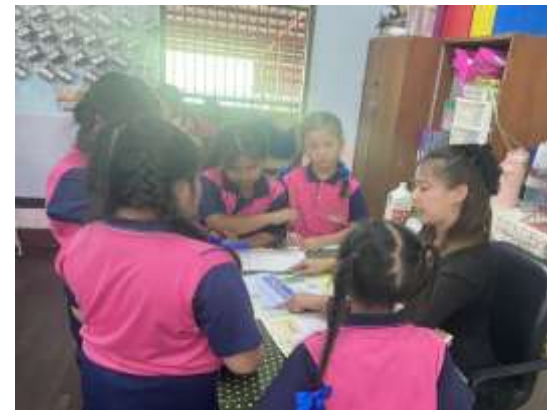
นักเรียนแกนนำร่วมกันกำหนดกิจกรรม พุทธิวิถี ๑ - ๔ ที่สอดคล้องกับพระบรมราโชบาย ในหลวงรัชกาลที่ ๑๐ โดยใช้หลักอิทธิบาท ๔