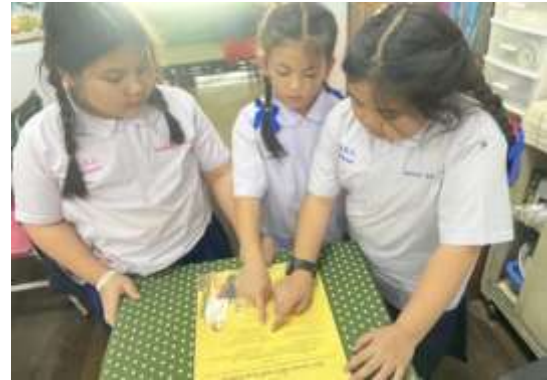
นักเรียนแกนนำร่วมกันศึกษาเกี่ยวกับพระบรมราโชบายด้านการศึกษาในหลวงรัชกาลที่ ๑๐