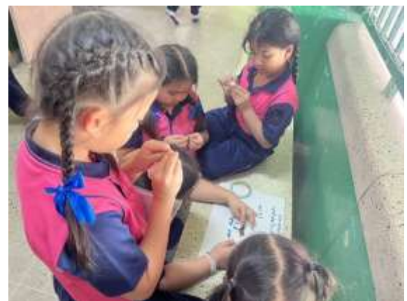
นักเรียนแกนนำจัดทำกระดาน พุทธิเต็มใจ เทิดไท้สามสถาบัน เพื่อบันทึกผลพุดิกรรรมการทำกิจกรรม หน้าเสาธงและกิจกรรมต่างๆที่เกี่ยวข้องกับชาติ ศาสนา และพระมหากษัตริย์