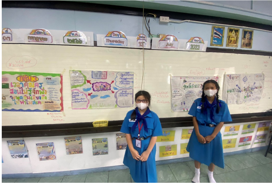
ภาพกิจกรรมประกอบการดำเนินการ โครงการคุณธรรม เรื่อง ห้องเรียนจรัลรักษาหน่วย นักเรียนในระดับชั้นประถมศึกษาปีที่ 5/2 โรงเรียนพุทธโสธร