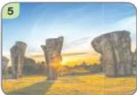
5 ▲ มอหินขาว