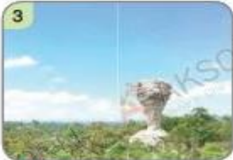
3 ▲ อุทยานแห่งชาติป่าหินงาม