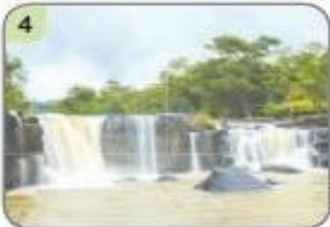
4 ▲ อุทยานแห่งชาติตาดโตน