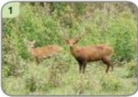
1 ▲ เขตรักษาพันธุ์สัตว์ป่าภูเขียว