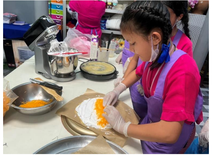
การส่งเสริมการดำเนินการทางธุรกิจ “กิจกรรม เฒ่าแกใหม่” คาเฟ่โรงเรียนพุทธิโสภณ