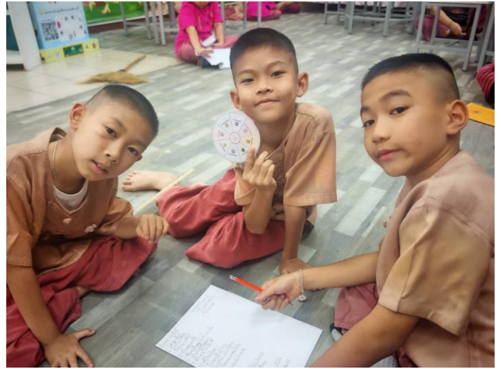
การดำเนินกิจกรรมในรายวิชาเพิ่มเติม “ด้านสุจริต”