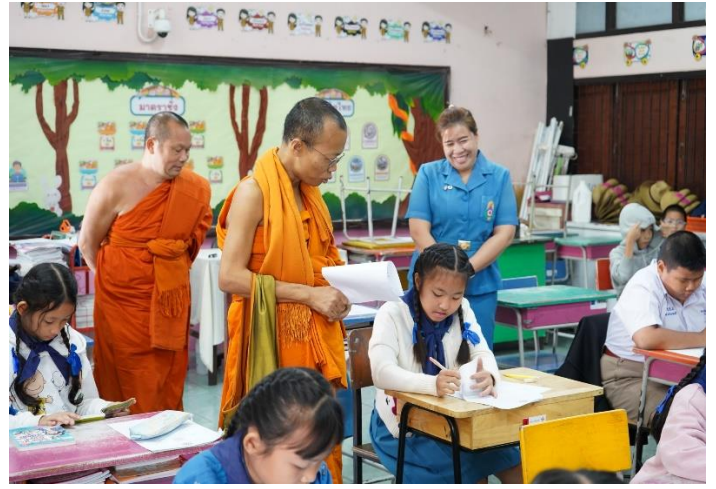
นักเรียนโรงเรียนพุทธโกน ระดับชั้น ป.4 - ป.6 สอบธรรมศึกษา ประจำปี 2568