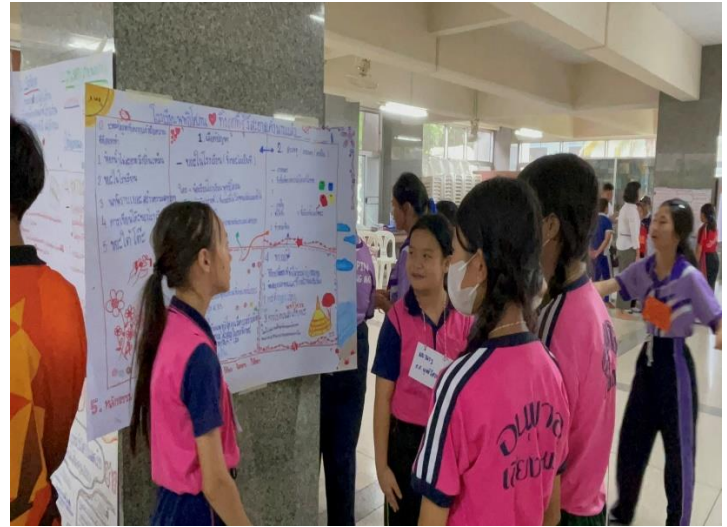
การนำโครงการคุณธรรมไปเผยแพร่ เข้าร่วมการแข่งขันศิลปะหัตถกรรม ครั้งที่ 73