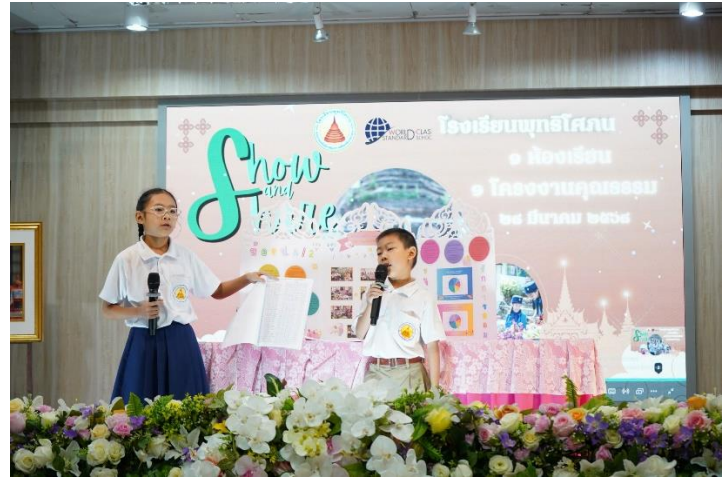
การดำเนินการ กิจกรรม 1 ห้องเรียน 1 โครงการ ในการเปิดส้วนวิชาการ Show and share