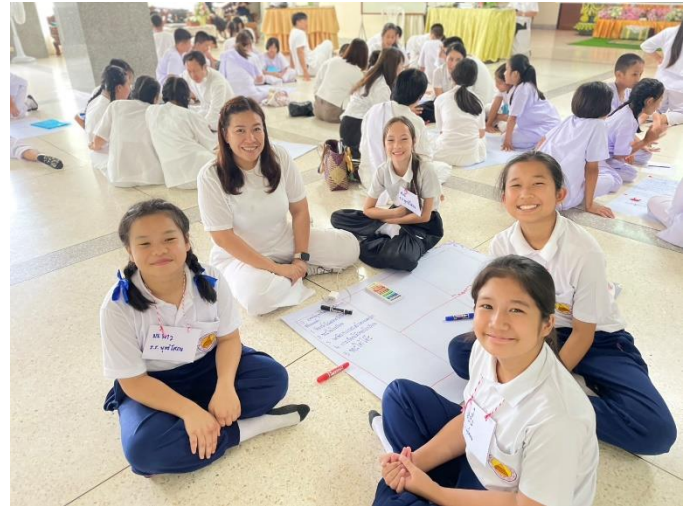
เข้าร่วมการอบรมครูและเยาวชนแกนนำ ด้านคุณธรรม ณ วัดร่ำเปิง จังหวัดเชียงใหม่ ระหว่างวันที่ 5 - 6 กรกฎาคม 2568