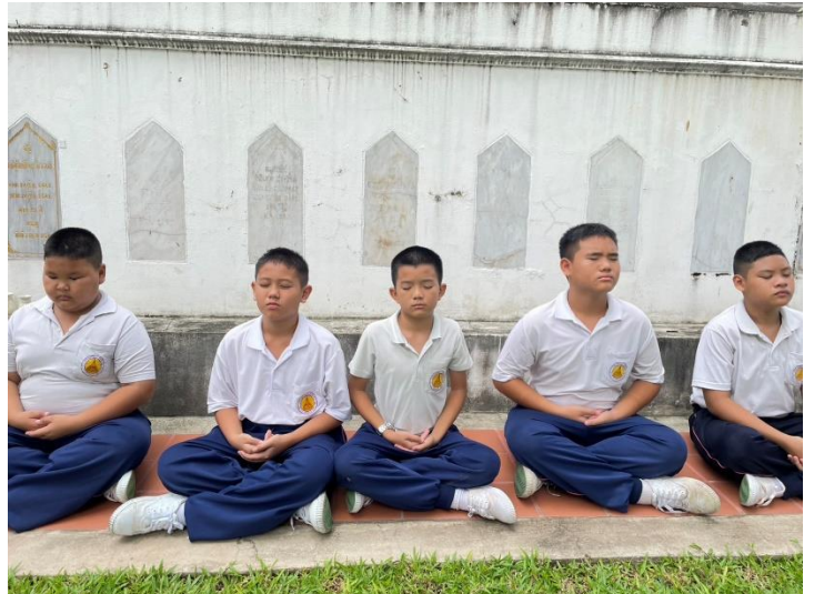
การพัฒนาสติ เจริญปัญญา ในกิจกรรมเข้าค่ายอบรมคุณธรรม และการนั่งสมาธิระหว่างบ่าย ก่อนเข้าเรียนคาบบ่าย