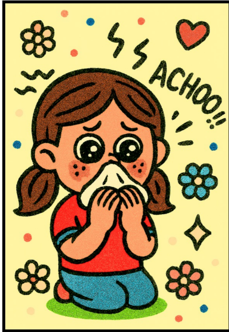
runny nose (น้ำมูกไหล)