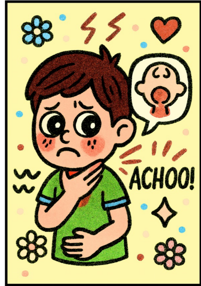
sore throat (เจ็บคอ)