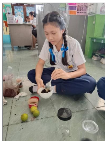
(ภาพวิธีการทำสกรับ และการทดลองใช้)