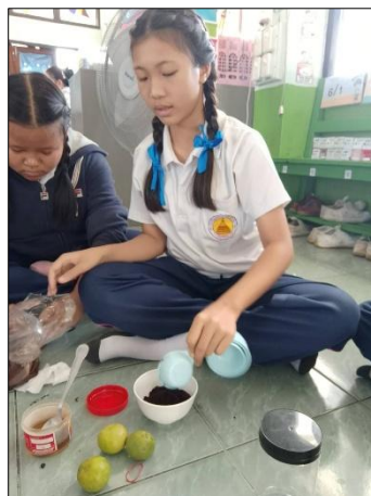
(ภาพวิธีการทำสครับ และการทดลองใช้)