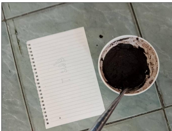
(ภาพสคริปกากกาแพ สูตรที่ 1)