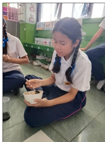
(ภาพวิธีการทำสกริป และการทดลองใช้)