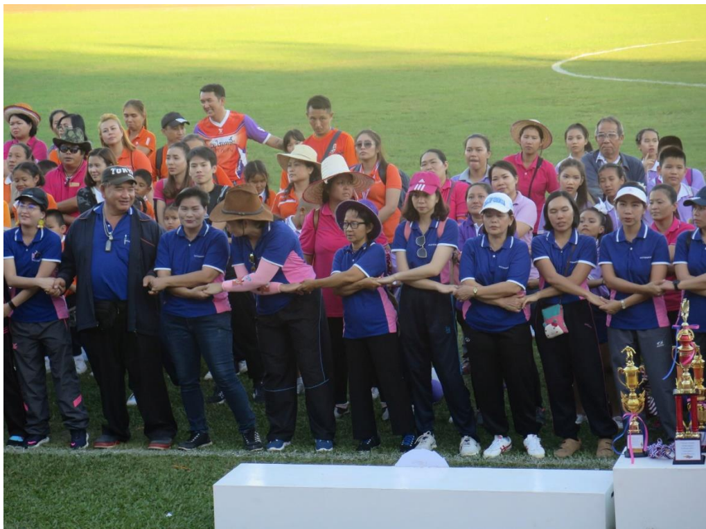
ภาพประกอบคุณลักษณะที่พึงประสงค์ของคนดีศรีแผ่นดิน ข้อ ๙. ไม่ยุ่งเกี่ยวยาเสพติดและอบายมุข