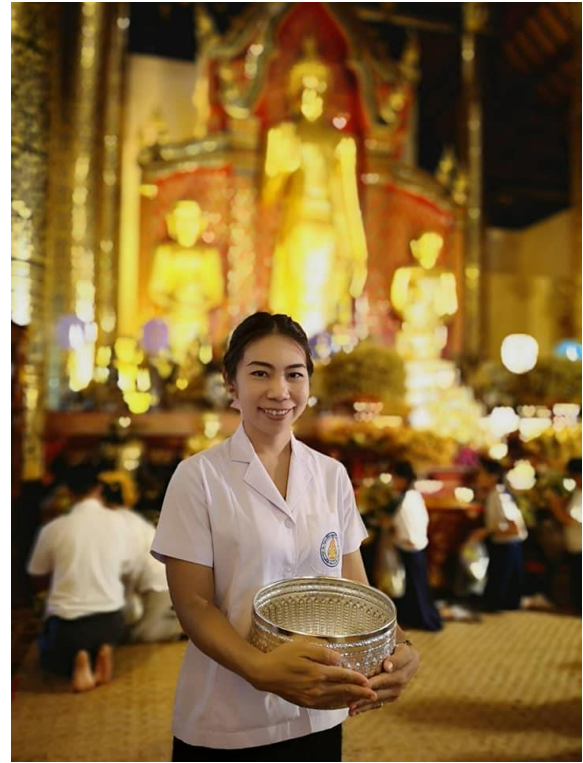
ร่วมกิจกรรมทำบุญตักบาตร