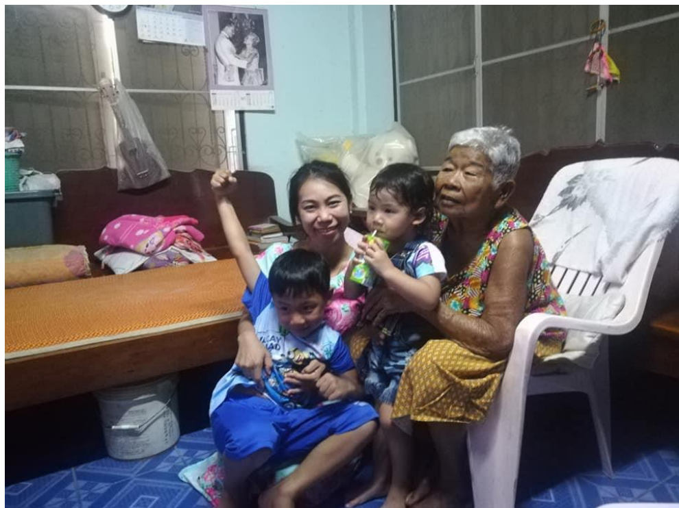
ภาพประกอบคุณลักษณะที่พึงประสงค์ของคนดีศรีแผ่นดิน ข้อ ๕. มีความรักผูกพัน เอื้ออาทร ห่วงใยกับบุคคลในครอบครัว