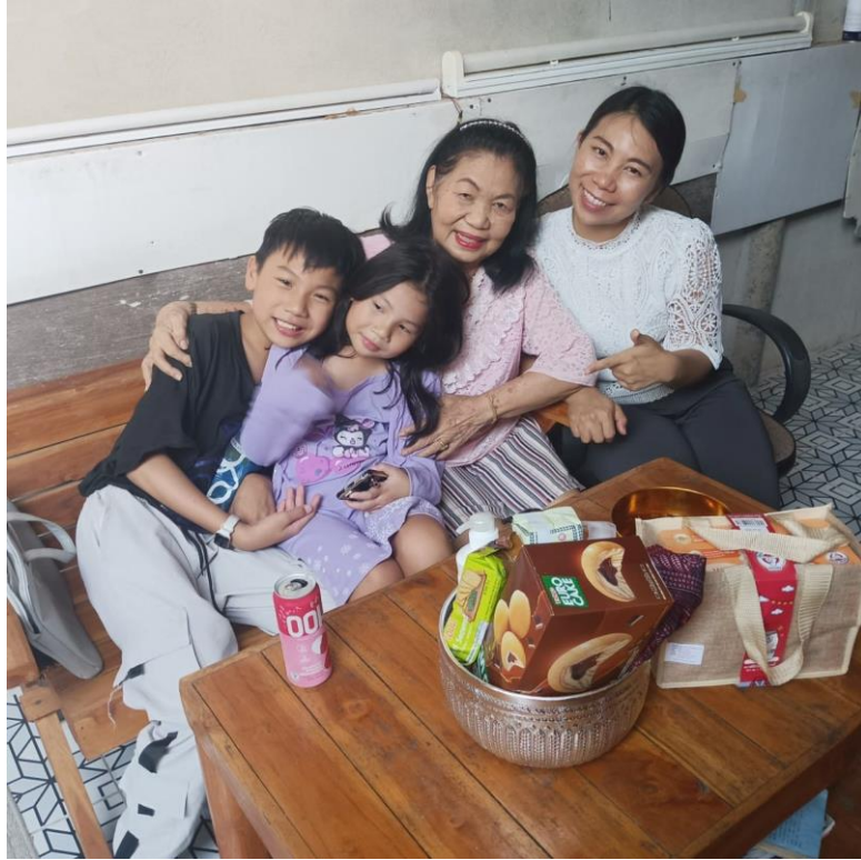
กิจกรรมรดน้ำดำหัวผู้ใหญ่ในครอบครัว