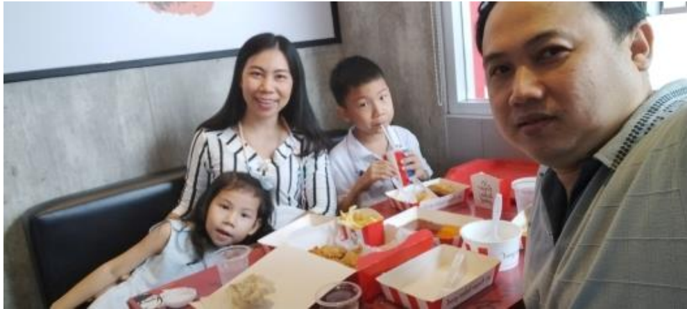
กิจกรรมยามว่างร่วมกับครอบครัว