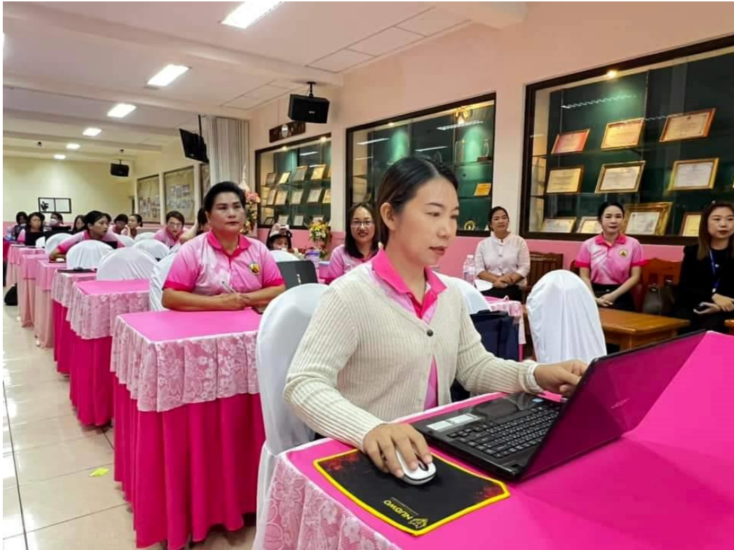
ภาพประกอบคุณลักษณะที่พึงประสงค์ของคนดีศรีแผ่นดิน ข้อ ๔. รักการเรียนรู้ในสิ่งที่ดี