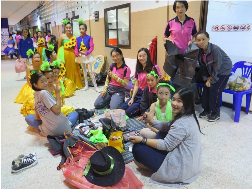
กิจกรรมกีฬาต้านยาเสพติด