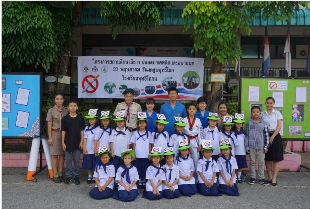
กิจกรรมอบรมให้ความรู้ โครงการสถานศึกษาสีขาว ปลอดภัยดีและอบายมุข