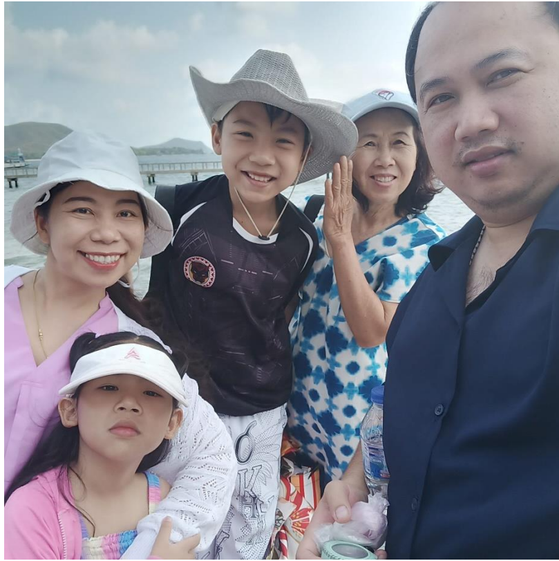
กิจกรรมพักผ่อนกับครอบครัว