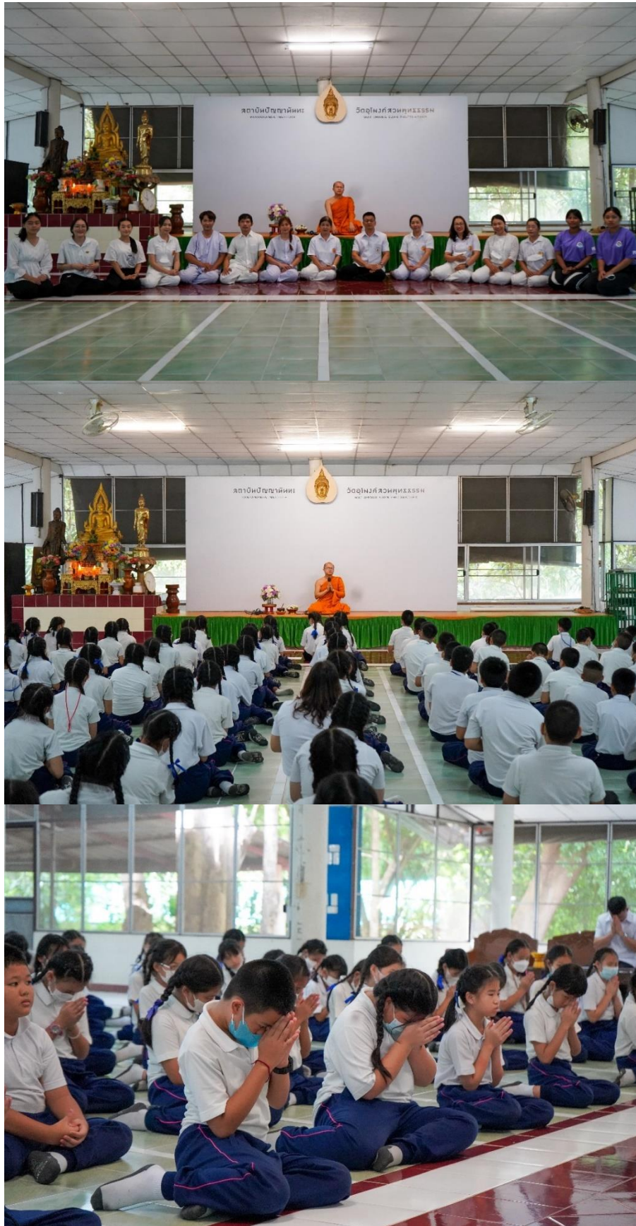
ภาพประกอบคุณลักษณะที่พึงประสงค์ของคนดีศรีแผ่นดิน