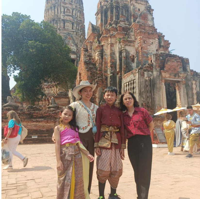
กิจกรรมพักผ่อนกับครอบครัว