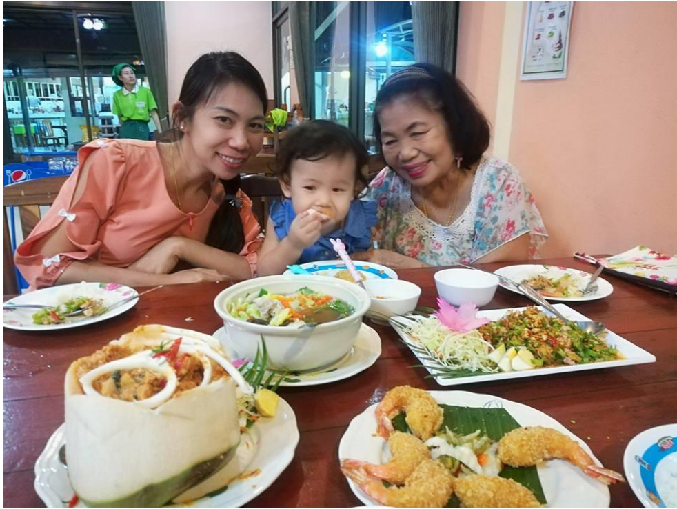
กิจกรรมยามว่างร่วมกับครอบครัว