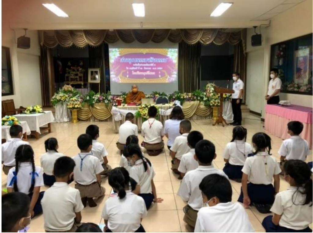
นำนักเรียนปฏิบัติกิจกรรมการเรียนรู้ด้านคุณธรรม จริยธรรม