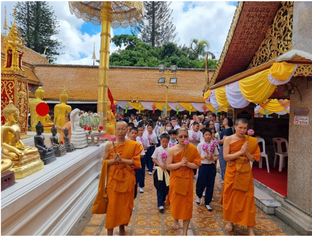
นำนักเรียนเข้าร่วมกิจกรรมเวียนเทียนที่วัดพระธาตุศอยสุเทพ