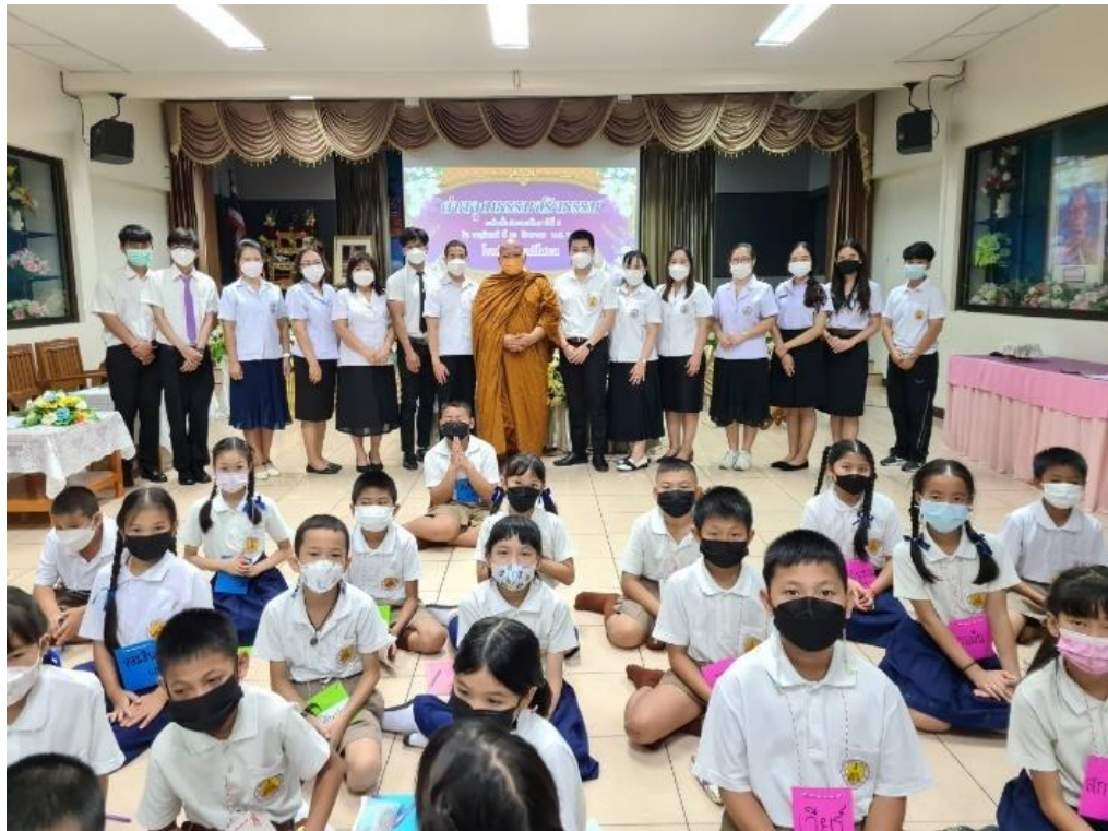
ภาพประกอบคุณลักษณะที่พึงประสงค์ของคนดีศรีแผ่นดิน ข้อ ๑. มีคุณธรรมและจริยธรรม