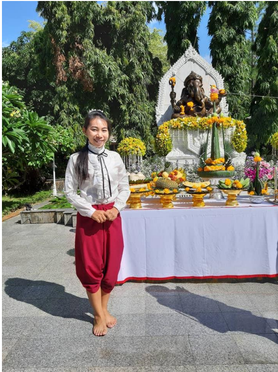
ร่วมกิจกรรมไหว้ครูนาฏศิลป์