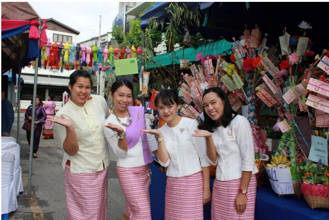
กิจกรรมทำบุญโรงเรียนและทอดผ้าป่าสามัคคี