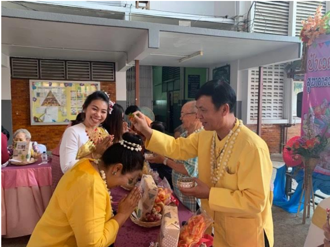
ร่วมกิจกรรมรดน้ำดำหัวผู้ใหญ่ ในป่าเวณี ปีใหม่เมือง