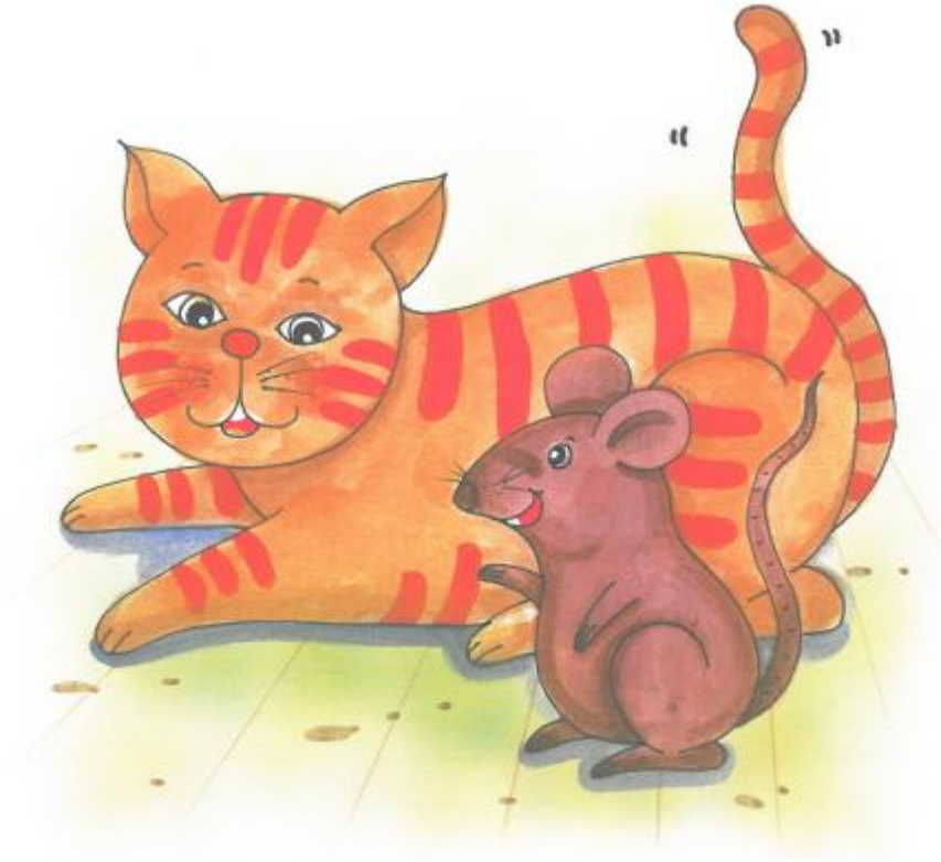
แมวเหมียวขี้อาย

เจ้าเหมียว เป็นแมวที่ชอบเดินทางเบิกบานใจ วันหนึ่งมันเดินผ่านทุ่งนาเพลิดเพลิด จนหลงทางไปเจอป่ากร้าง มันเก็บเงินและ เงินอายุที่จะถามทาง จนกระทั่งได้พบกับ สุนัขจิ้งจอกที่ดูเพื่อเจ้าและเฉยเมย ถามอะไร ก็ทำหน้าเฉยๆ เจ้าเหมียวเลยเดินต่อไปเอง จนถึงบ้าน