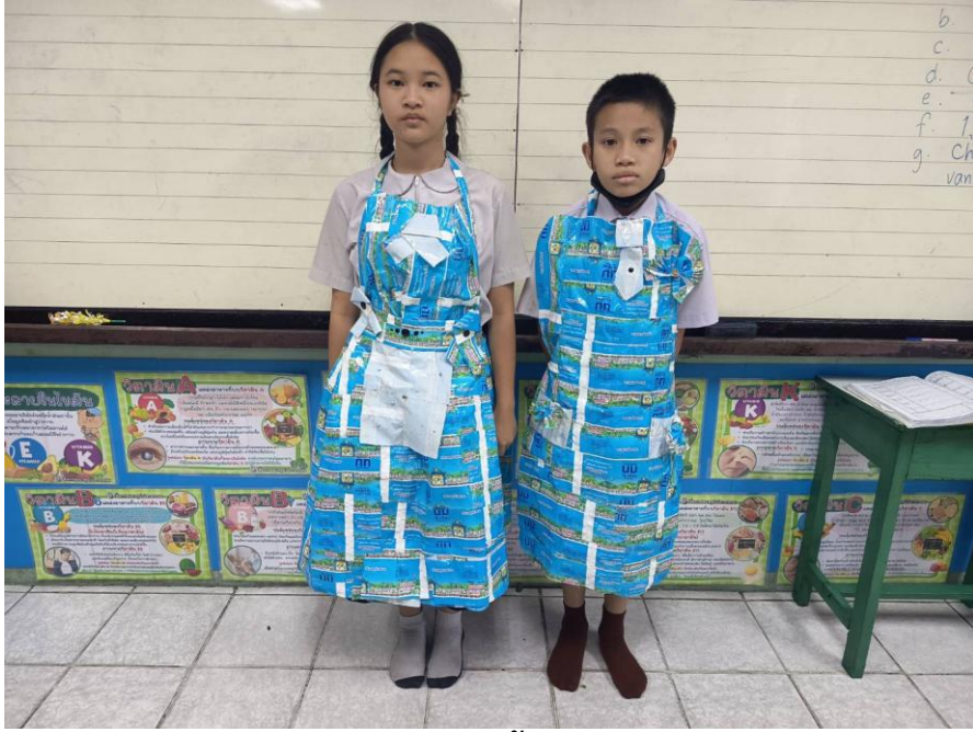
ผ้ากันเปื้อน