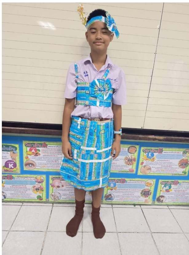
ชุดรีไซเคิล