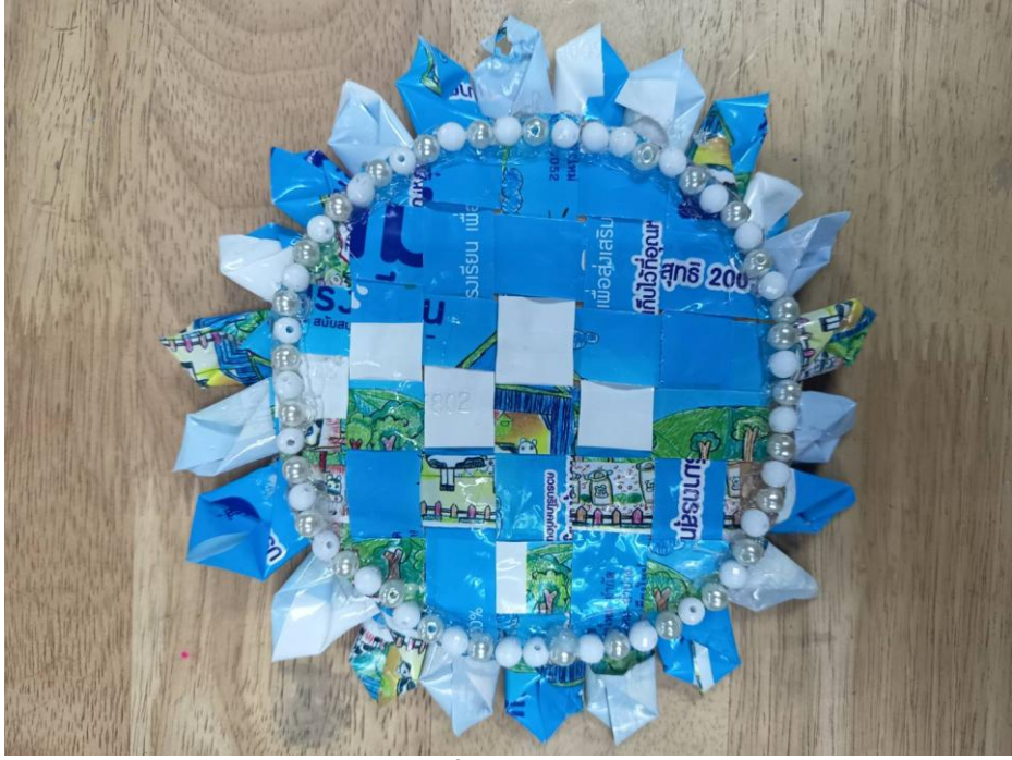
ที่รองแก้ว