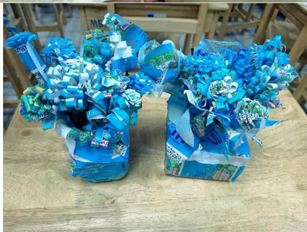
ดอกไม้ประดิษฐ์