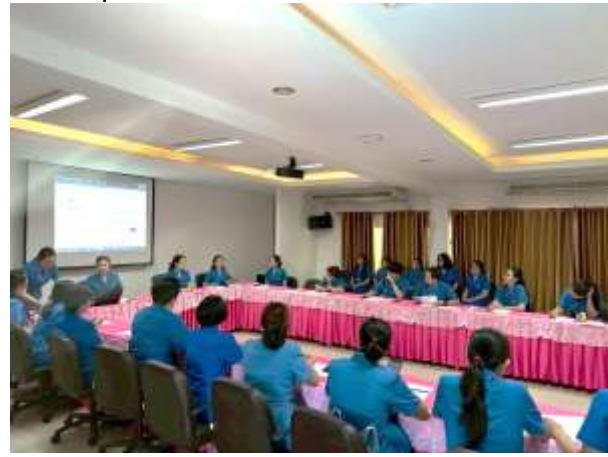
การประชุมร่วมกันของผู้บริหารคณะครูบุคลากรทางการศึกษานักเรียนในการระดมความคิด