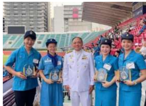
รางวัลยุวกาชาดดีเด่น ประจำปี ๒๕๖๖

รางวัลโล่พระราชทานสมเด็จพระกนิษฐาธิราชเจ้า กรมสมเด็จพระเทพรัตนราชสุดาฯ สยามบรมราชกุมารี อุปนายิกาผู้อำนวยการสภากาชาดไทย ประจำปีการศึกษา ๒๕๖๖