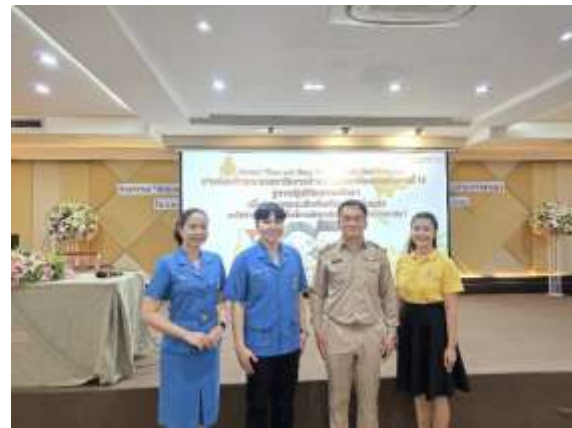
เผยแพร่และนำเสนอวิธีการปฏิบัติที่เป็นเลิศ (Best Practice) น้อมนำพระบรมราโชบายด้านการศึกษาในหลวงรัชกาลที่ ๑๐ สู่การปฏิบัติ

๗.๑.๒ การเผยแพร่ผลงานและกิจกรรมทางช่องทางสื่อออนไลน์ ได้แก่ การเผยแพร่ทาง Website https://puttisopon.ac.th/ และ Facebook โรงเรียนพุทธิโสภณ - Puttisopon School ประชาสัมพันธ์ผ่านจดหมายข่าวของโรงเรียนพุทธิโสภณ