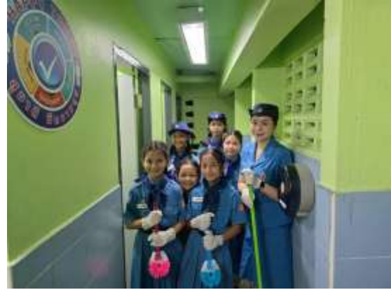
กิจกรรมจิตอาสาบำเพ็ญประโยชน์