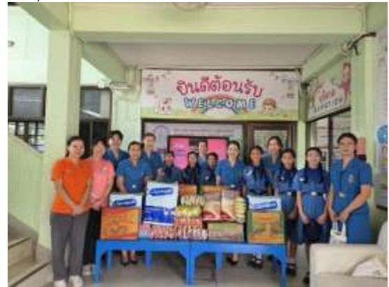
ร่วมบริจาคเงินเพื่อจัดซื้อของใช้จำเป็นนำไปบริจาคให้กับสถานสงเคราะห์เด็กเวียงพิงค์