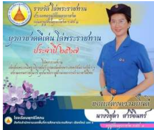
ยวกาชาติดีเด่น ประเภทครูผู้สอนยวกาชาติระดับ ๑ ประจำปี ๒๕๖๒

รางวัลโล่พระราชทานสมเด็จพระกนิษฐาธิราชเจ้า กรมสมเด็จพระเทพรัตนราชสุดาฯ สยามบรมราชกุมารี อุปนายิกาผู้อำนวยการสภากาชาดไทย ประจำปีการศึกษา ๒๕๖๒