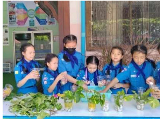
กิจกรรมยุวกาชาดอนุรักษ์สิ่งแวดล้อม