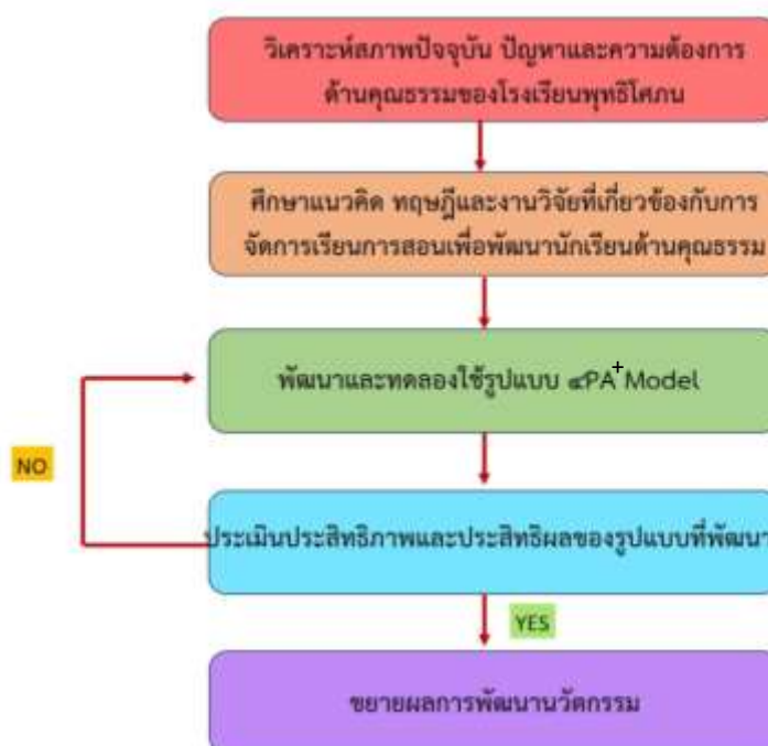
แผนภาพขั้นตอนการพัฒนานวัตกรรม

การพัฒนากระบวนการจัดกิจกรรมการเรียนการสอนด้วยกระบวนการ \alpha PA+ Model สร้างคนดี มีคุณธรรม ด้วยกิจกรรมจิตอาสา เป็นนวัตกรรมด้านการเรียนการสอน เพื่อพัฒนานักเรียนให้มีคุณธรรม จริยธรรม ตามกรอบคุณธรรมอัตลักษณ์ของสถานศึกษา และสอดคล้องกับคุณลักษณะโรงเรียนคุณธรรม สพฐ. มีขั้นตอนในการพัฒนานวัตกรรม ดังนี้