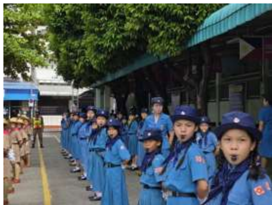
กิจกรรมอบรมลูกเสือ-ยุวกาชาดจราจร