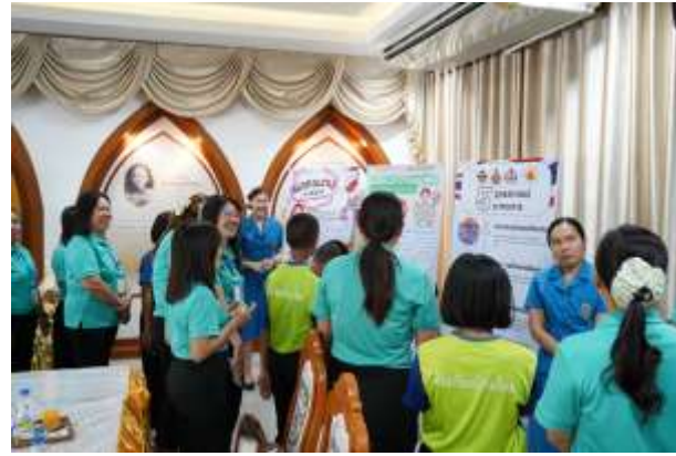
การเผยแพร่ผลงานแก่คณะที่มาศึกษาดูงาน