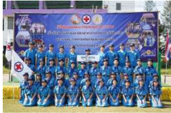
- รางวัลระดับ “ดีเยี่ยม”ในการประกวดการเดินทางสนนยามยุวกาชาดระดับ ๒ ประเภททีมเดี่ยว ในงานวันคล้ายวันสถาปนายุวกาชาดไทย ประจำปี ๒๕๖๘ (๑๐๓ ปี ร่วมใจสร้างสรรค์ยุวกาชาดไทย)