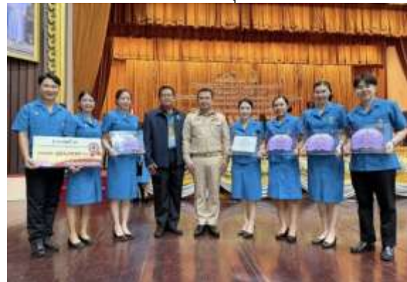
รางวัลที่ ๓ การประกวดสื่อส่งเสริมระเบียบวินัยของยุวกาชาด เงินรางวัลจำนวน ๑๐,๐๐๐ บาท