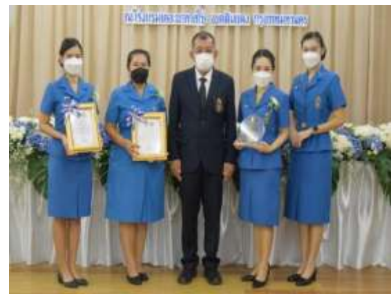
รางวัลหมู่ยุวกาชาดต้นแบบระดับประเทศ ประจำปี ๒๕๖๕