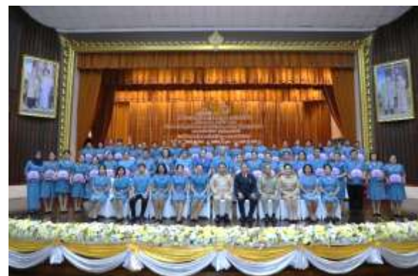
- รางวัลเชิดชูเกียรติยวกาชาติ ประจำปี ๒๕๖๒ จากกระทรวงศึกษาธิการ