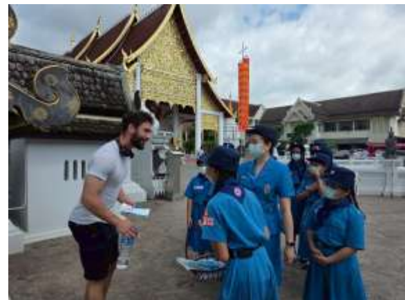
กิจกรรมยุวกาชาดส่งเสริมอนามัย