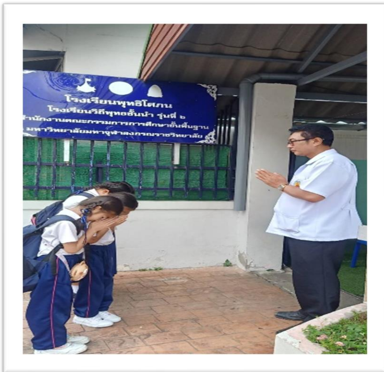
ดูแลนักเรียนตอนเช้าและเย็น เยี่ยมบ้านนักเรียนตามนโยบายเยี่ยมบ้าน 100 %